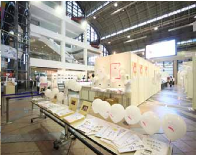
映画やテレビにも出演している埼玉県立松山女子高校書道部から出品された、精魂込めた100枚の色紙。