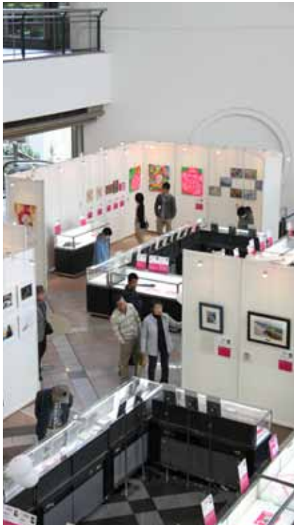
来場者は地元神戸市在住の方が大多数。中には九州など遠方からいらした方も