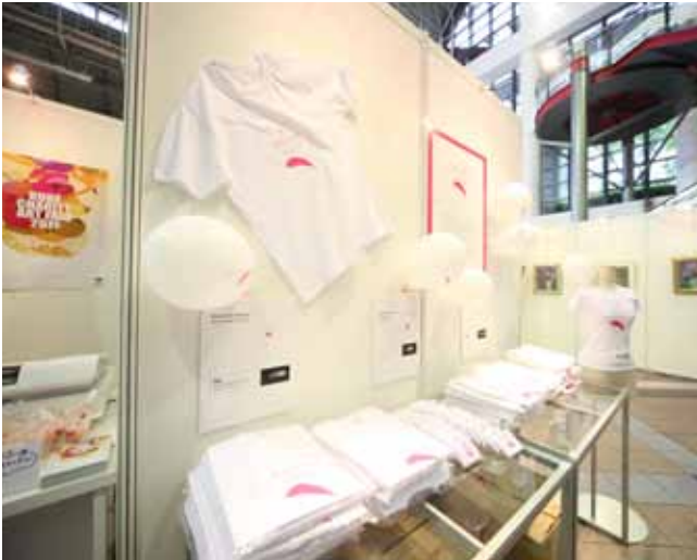
関連グッズはTシャツ、アロマキャンドルなど。風船と共に優しいデザインが好評を博した