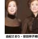
由紀さおり・安田祥子姉妹