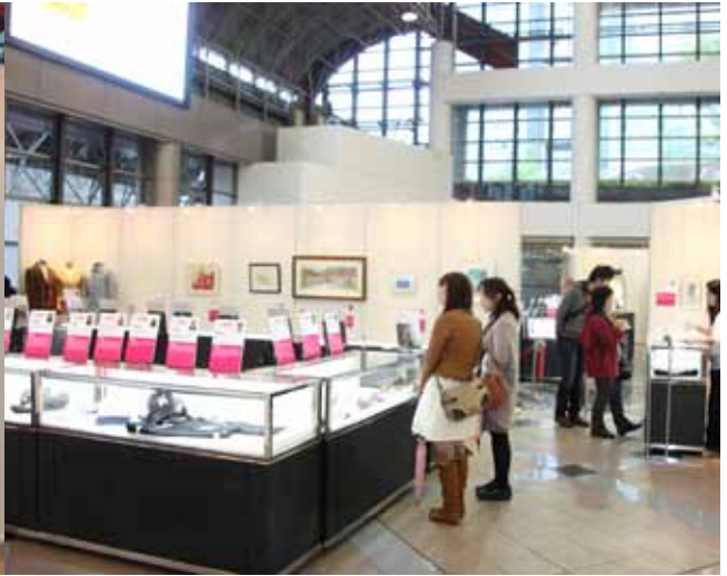
ショーケース内に展示された貴重な出典品の数々。著名人ばかり、見ているだけでも楽しい