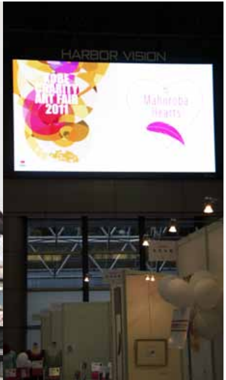
巨大なハーバービジョンに映し出された当フェアのロゴ。来場者の注目を浴び、写真撮影する人も