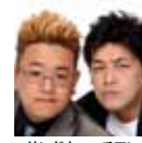
サンドウィッチマン