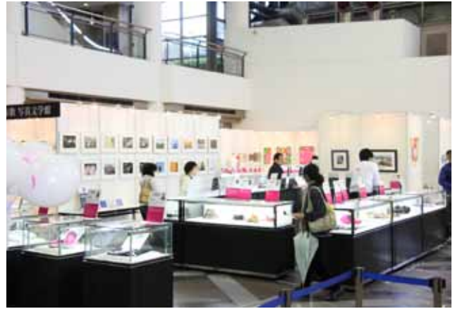
義援金になるのならと購入される方もいた。神戸市民の協力無くして成り立たなかったといえる