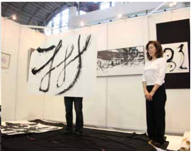
「祈」。遠く離れた東北で避難生活を送る方々にも、この想いが届きますように