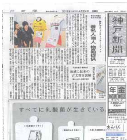
4/24 神戸新聞朝刊。兵庫県出身サッカー選手香川真司さんと野球選手藤本敦士さんのサイン入りユニフォームと子供たち