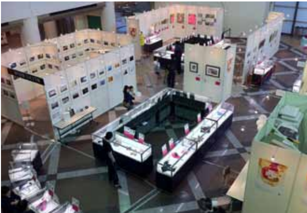
会期は2日間。初日より2日目の方が来場者は多かった。24日午後3時、惜しまれつつ終了