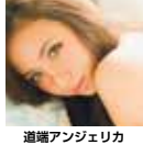
道端アンジェリカ