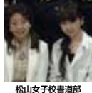
松山女子校書道部