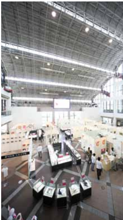
地下1階から地上6階まですべてを吹き抜けにした空間。床面積600㎡を超えるこのスペースに注目が集まった