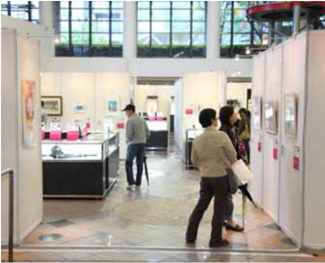
現代アーティストから出品された絵画や書道など。普段は目に触れることのない名品に釘付け