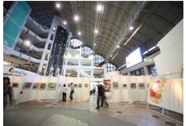
スペースシアター内ではオリジナル風船を配布。「もっとほしい！」と泣き出す子も