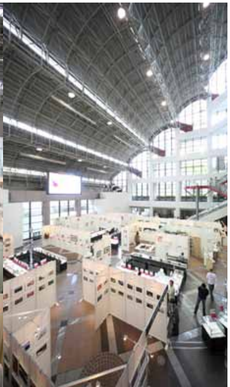
現代詩歌と写真を組み合わせた文学館も好評。独特の魅力に、じっくりと読みふける姿があった