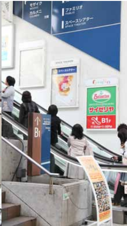
ポスターやバナーに羅列された103名の著名人の名前に歓声（奇声？）をあげる来場者も多数