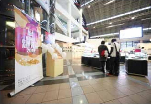
目当ての品を前に目を輝かせる来場者も多数。家族や友人と会話をはずませ楽しんでた