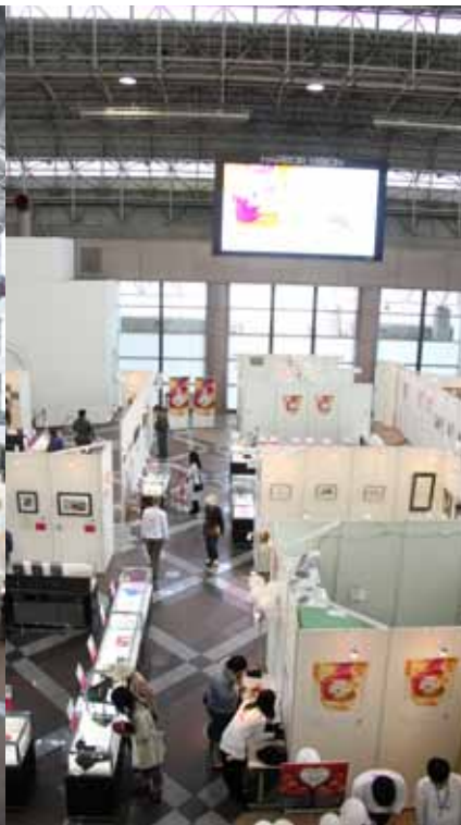
300を超える展示品。昼夜を問わずの細心の注意を払った警備の結果、盗難などの問題無し